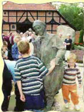
Verkehrsverein Dorfmark e.V.